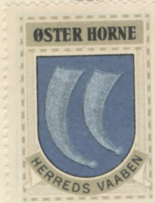
Øster Horne Herred

Torstrup, Horne, Hodde, Tistrup, Ølgod, Ansager.